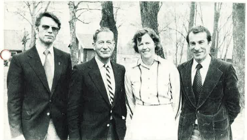
NIF's formann sammen med hovedinnlederne på formannsmøtet.