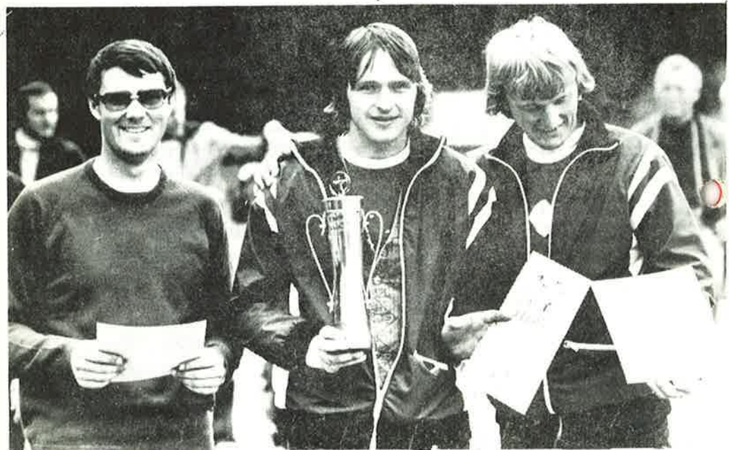
TOB's seirende lag.