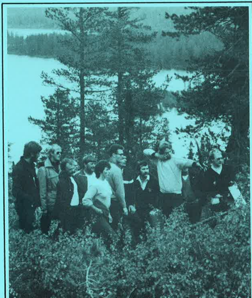
BANELEGGERSKURS FOR JAKT/FELT.