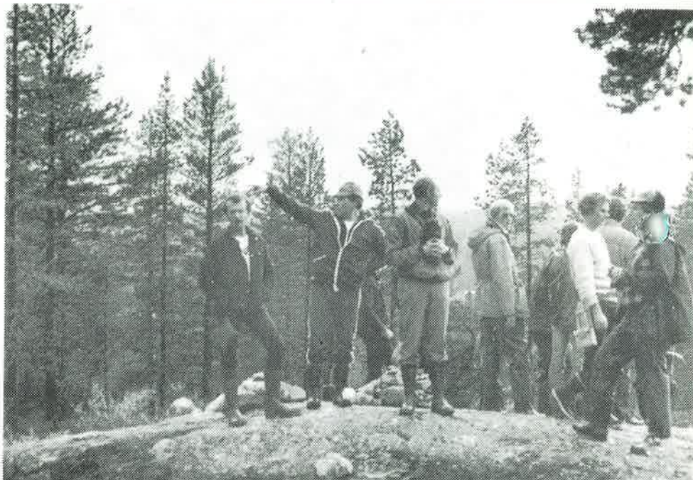
Bilder fra baneleggerkurs Jakt/Felt på Fagerfjell