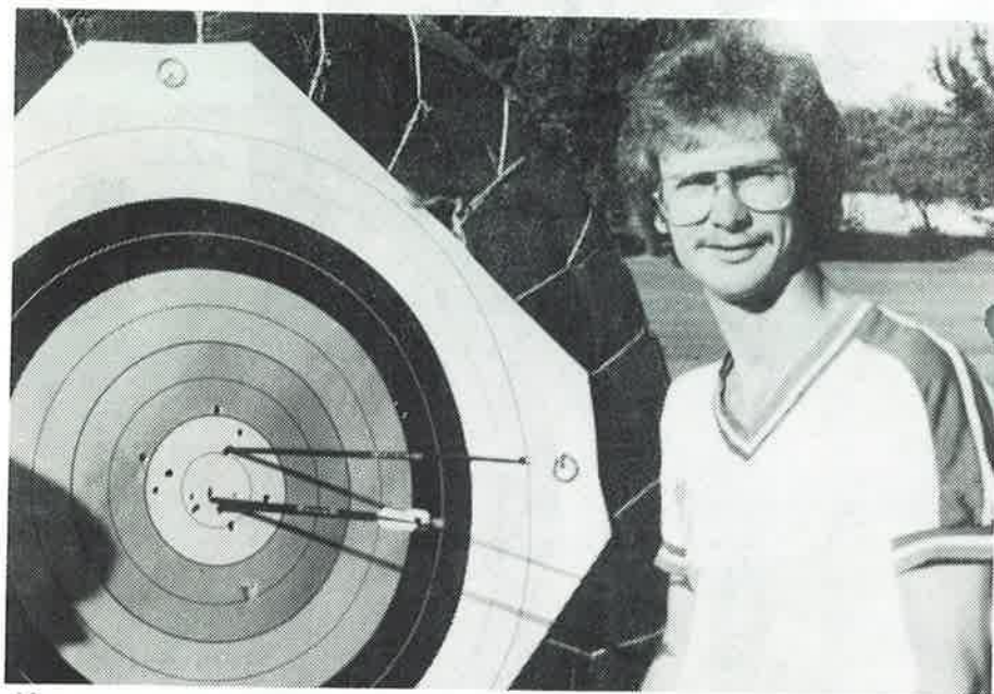
Her taper Paces V.M.-tittelen. Som man ser av bildet har den pil som sitter i nieren slått ut.