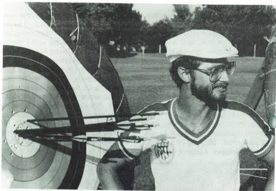
Mc Kinney, USA