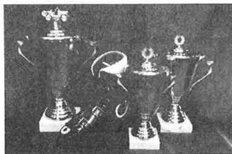
Bestill vår katalog nr. 16