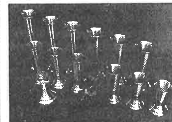
Alt i pokaler, medaljer og statuetter