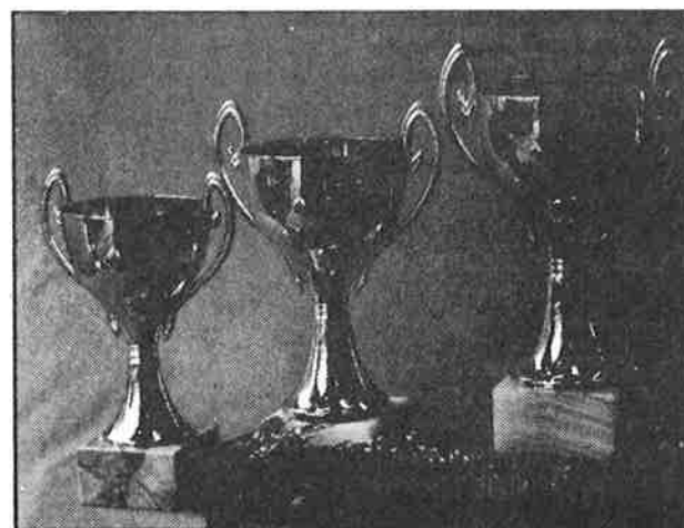
Hurtig rimelig gravering