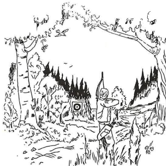
BUESKYTING - OGSÅ EN NATUROPPLEVELSE

Dette systemet krever mye trening, og er beregnet for å holde under de stress situasjoner som oppstår i store konkurranser. Det krever vilje til og virkelig arbeide med detaljer, og automatisering av slippet er en forutsetning. I tillegg bør du ha rytme i skytingen og tørre å slippe deg løs og tro at du treffer. Det finnes ingen snarvei, bare tålmod og jevn trening er nøkkelen. Lykke til!