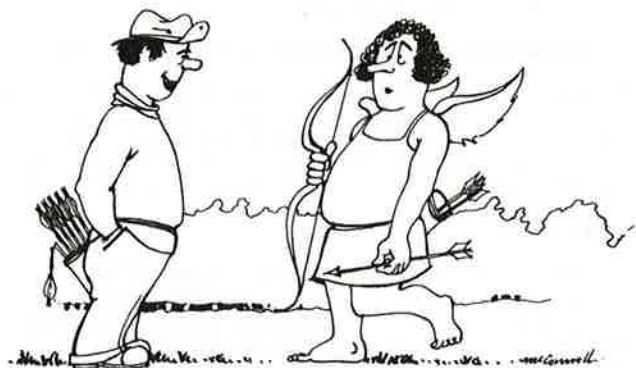
ER DU BLITT PROFF SIDEN SIST ?