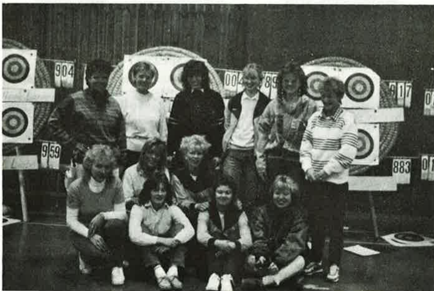
Larvik 22/2: Kvinner som både tør, kan og vil

Disse skytterne som har blitt så gode, har alle klart det fordi de har overvunnet det vanskelige ved å skyte med pil & bue. Siden ingen har en kropp som er 100% ideell til bueskyting, må alle som vil bli gode finne