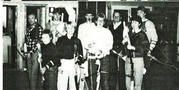
GLIMT FRA HEDEMARKSBESØKET