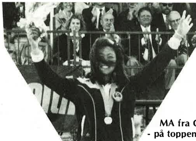
MA fra China - på toppen til slutt!

Rustamova, Sovjet vant 60 meter, og etter ferdigskutt langhold besatte de tre nevnte «stormakter» de 10 første plassene. Tyskerne hadde nå 3 og finnene 2 på finaleplass. Esheev gikk opp i ledelsen sammenlagt etter 70 meter som forøvrig ble vunnet av Schroepfel, Tyskland som dermed ga Tyskland sin annen distanseseier av 2 mulige. Distansen ga ingen fremgang for nordmennene som med 294/286 havnet langt bak i køen. Dad Kjetil lå nå 30 poeng bak siste finaleplass som Gøran Bjerren-