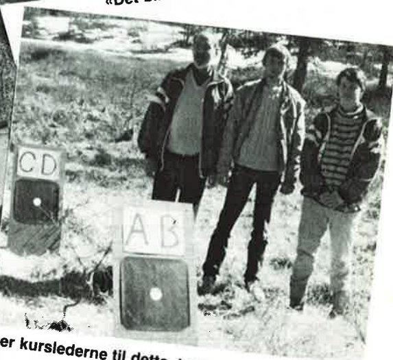
«Hva sier kurslederne til dette, tro?»