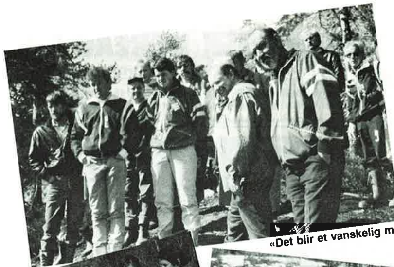
«Det blir et vanskelig mål»