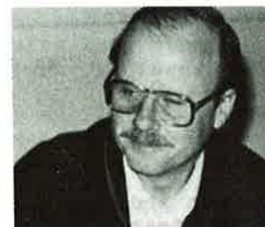
Forbunds treneren registrerte med tilfredshet at budsjettet på toppidrettssektoren ble vedtatt enstemmig.

Budsjettet ble gjenstand for relativt liten diskusjon. Det var enighet om at man burde plusse på kr. 50.000,- til rekrutterings-tiltak, mens det var mindre enighet om tilsvarende reduksjon over andre poster. Da daglig leder foreslo å «svække budsjettbalansen» med dette beløp, pustet alle lettet ut. Så får vi se om budsjettbalansen i praksis blir svekket, m.a.o. om vi klarer å utnytte alle tilgjengelige midler.