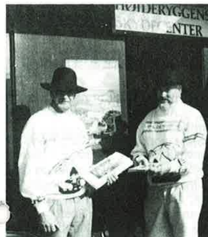
Deler av VM-komiteen i aksjon med brosjyremateriell.

Feltrunden ble skutt etter de nye internasjonale reglene, og som sådan var dette en fin gjennomkjøring – der Norge totalt sett gjorde seg bemerket. (Det siste kan også skyldes vår VM-komitee som var på PR-tur til denne konkurransen som man viste ville samle de fleste felt-interesserte danske og vest-tyske bueskyttere).