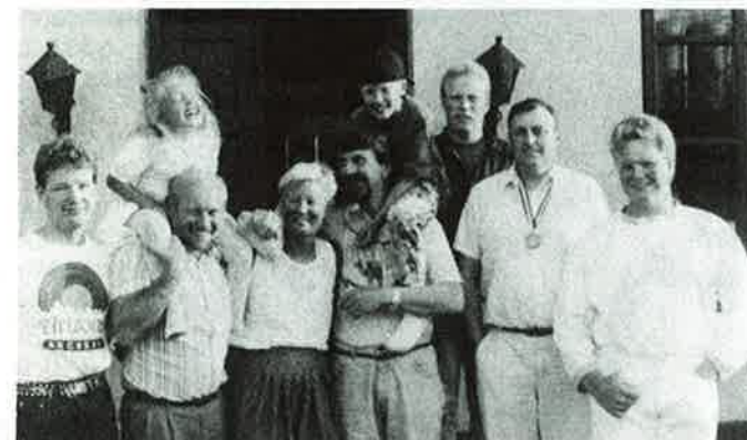
«Norway Archery Team» m/maskotene

Det deltok i alt 162 skyttere i de forskjellige klassene.