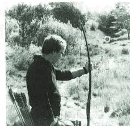
En av deltakerne i klassen for langbuer!