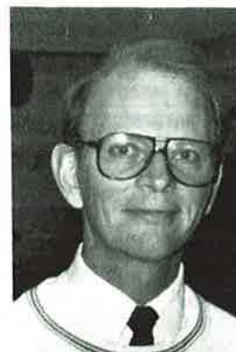
av Håkon Hasselgård

I siste nummer av Buestikka ga jeg et referat fra det fjerde internasjonale trenerseminar i Belgia hvor 19 lands trenere var samlet. I samme artikkel lovet jeg også å komme tilbake med mer stoff omkring Rick Mc. Kinneys forelesning om mental trening.