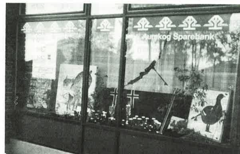
Arrangøren hadde markedsført seg bra i lokalmiljøet.