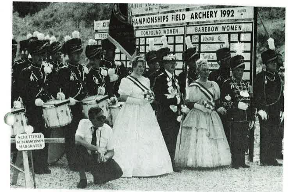
Musikkorpset holdt stilen – usymptomatisk for mesterskapet forøvrig.