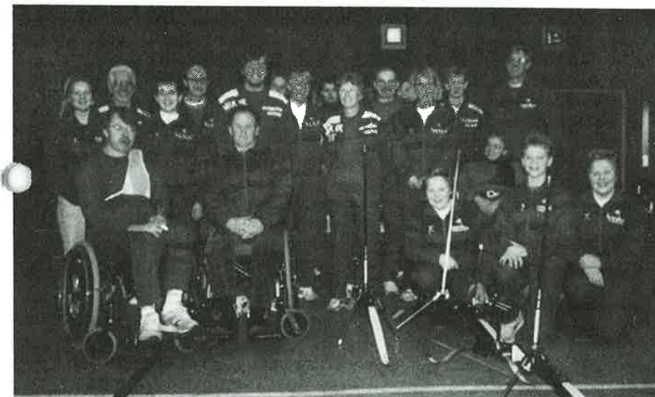
Aurskog/Høland fortsatt størst på stevne!