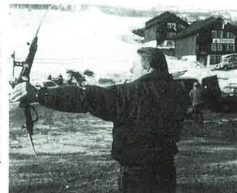
En spent bue foran alpinanlegget i Oppdal, der Aamodt og Thomba thombler seg, vakte oppmerksomhet!