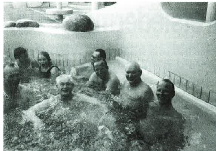
Smilende nordmenn nedsenket i vann fra Islands varme kilder.

ter både recurv og compound i samme klasse under visse forutsetninger. Målet er å få de samme to klassene innen handicapskyting som innen FITA med de fordeler dette innebærer for alle.