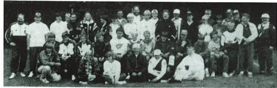
Solid norsk Innslag!