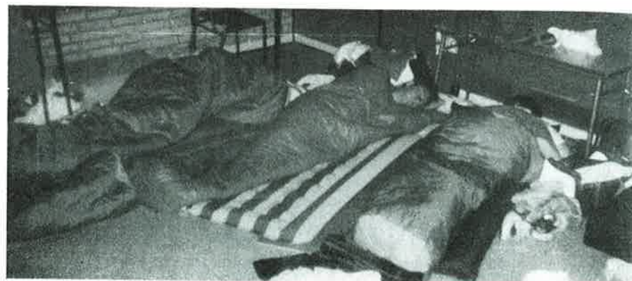
Omtrent som på gutterommet hjemme?