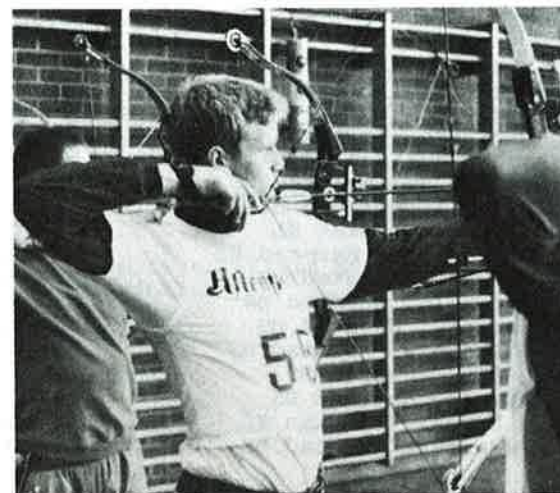
Aftenposten markerte seg under innendørs NM!