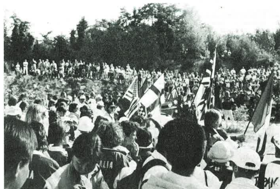
Stor stemning på finaledagen!

Faktisk gikk deler av skytingen midt i vinmarkene og det får være en kuriositet at noen ikke var informert, som det heter; det kom nemlig et helikopter og sprøytet vinrankene med insektmiddel midt under skytingen. Eller kanskje bueskytterne ble sett på som parasitter?