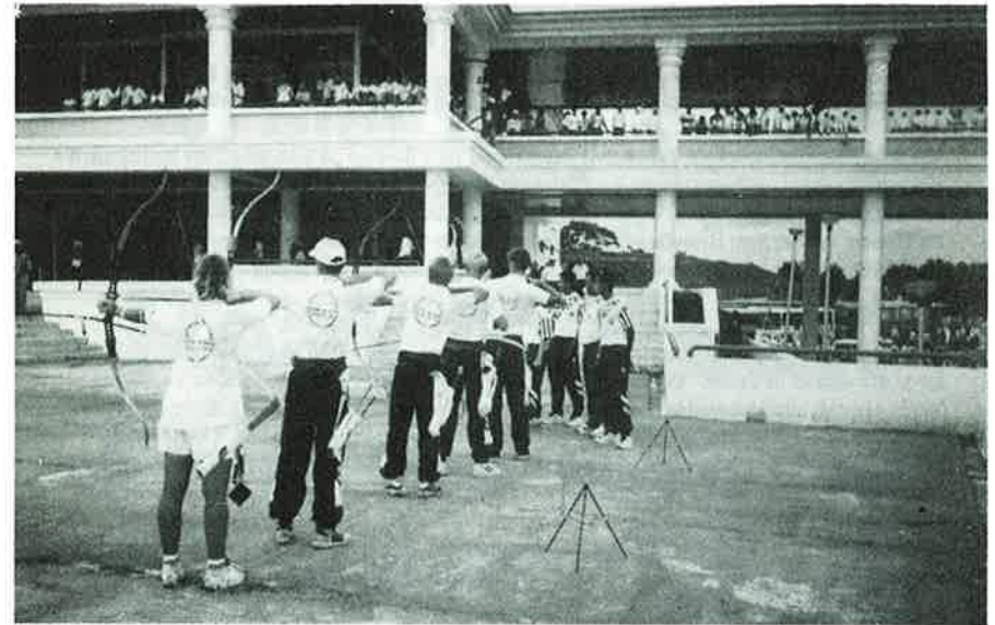
Norske bueskyttere åpner idrettsanlegg i Kuantan!

Hjemreisen var like lang som reisen bort – men gikk også bra.