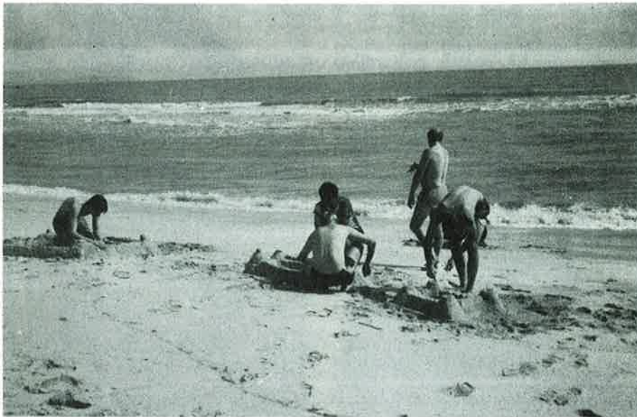
"Koordinasjonstrening" på stranden i Kuantan!

som vi jogget til og fra – og på. Vi fikk prøvd masse eksotiske frukter – og drakk masse av kokosnøtter. Nasjonalfrukten "Durang" anbefales til alle våre fiender.