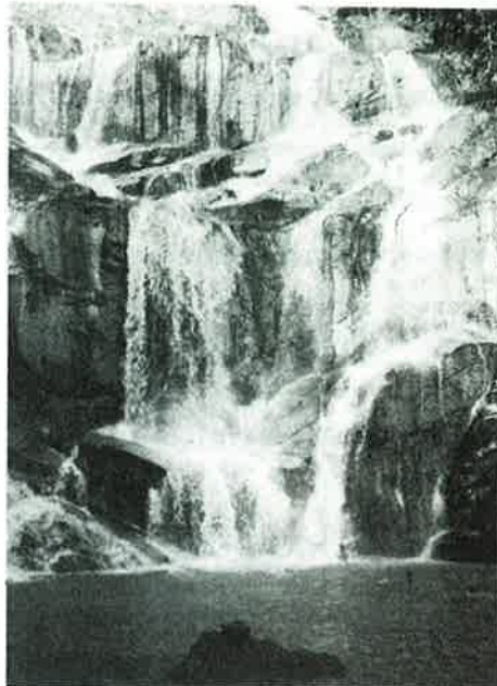
Badetur i eksotiske omgivelser!

Vi ble tatt vel imot av det malaysiske vertskapet, spesielt av Rohani (som sto bak invitasjonen) og av Lim, som var treneren i Kuantan. Begge hunkjønn.