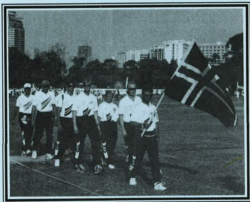
Den norske troppen under Innmarsjen ved VM i Indonesia!