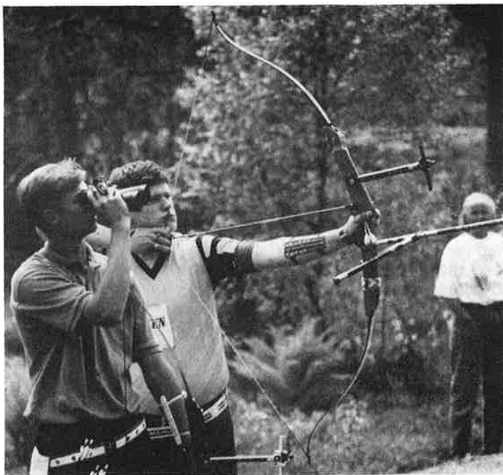
Martinus måtte se langt etter gullet denne gang!