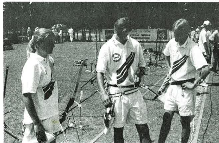
Det norske laget i «en stille stund» før slaget.

Av økonomiske grunner hadde man valgt å trekke flyreisen ut av en chartertur til Tyrkia, og siden denne også gikk til nærmeste flyplass fungerte dette fint. Flyet lettet kl.23.00 fra Sola og vi forberedte oss på en lang natt i trange flyseter, men til alt hell var flyet halvfullt og alle fikk en avslappende tur gjennom natten.