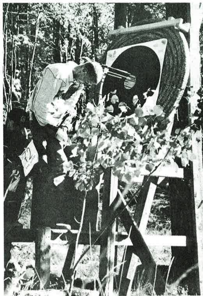
Forseggjort mål – fra standplass så det ikke slik ut.....

Forøvrig hadde arrangøren løst utlegg av feltrunden på enkel måte. I og med at man har oppgitte mål på felten, benyttet man ganske enkelt jaktbanen om igjen. Man lot jakta's «ekstra mål» stå uten skiver; dermed lite arbeid i endringen og alle fant greit fram.