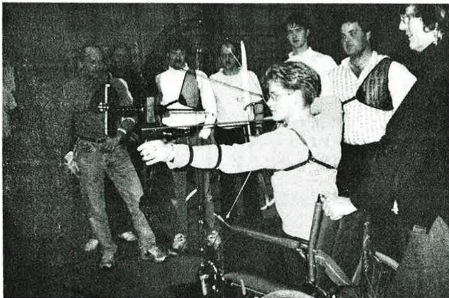
Trenerkandidatene ser nærmere på utfordringene innen handicapbueskytingen

Denne helgen hadde en fin veksling mellom interessant teori, lærerik praksis og artige diskusjoner. Der emnene varierte fra kroppen vår/fysisk trening til utstyrslære, instruksjonsmetodikk mm. Vi hadde lært veldig mye, og satt gammel kunnskap inn i et helhetlig system.