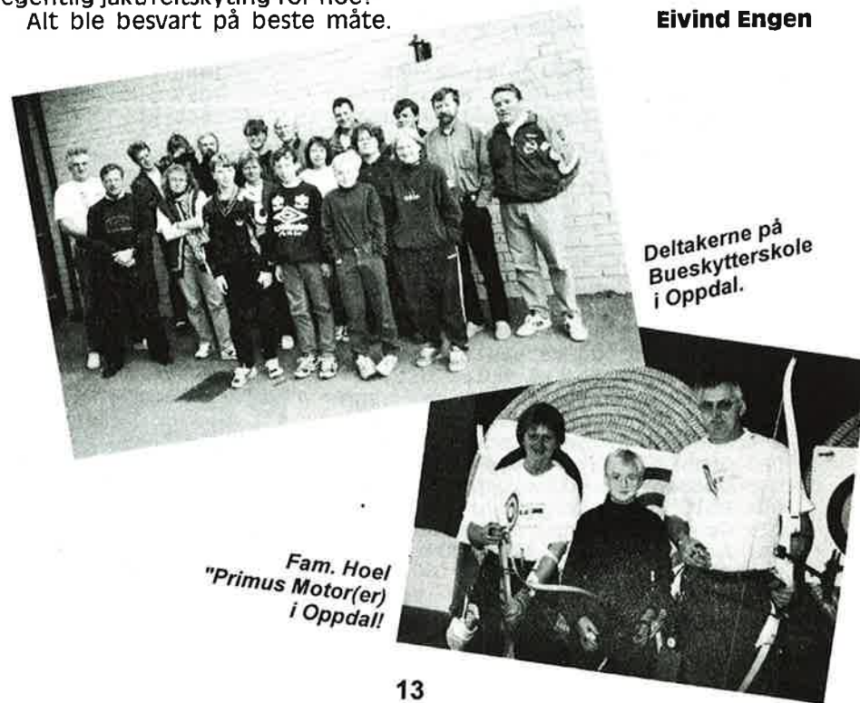
Deltakerne på Bueskytterskole i Oppdal.