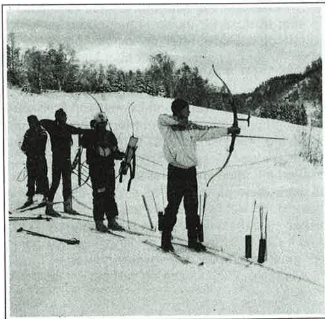
Vanskeleg å roe ned etter ein skispurt!