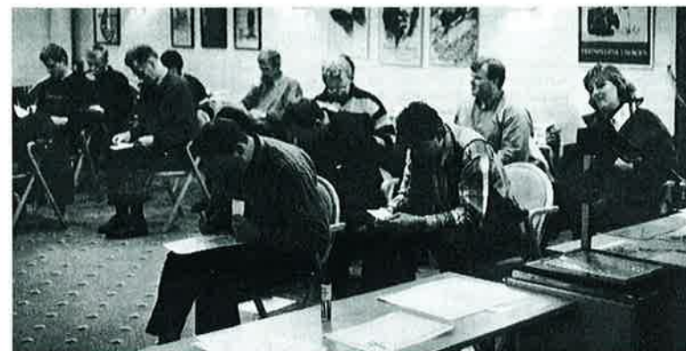
Deltakerne i Bergen får en "a-ha"-opplevelse omkring dårlig kommunikasjon og de følelser av avmakt og liten motivasjon dette medfører på "grunnplanet" i klubben.

Men i sum altså - svært positivt hittil.