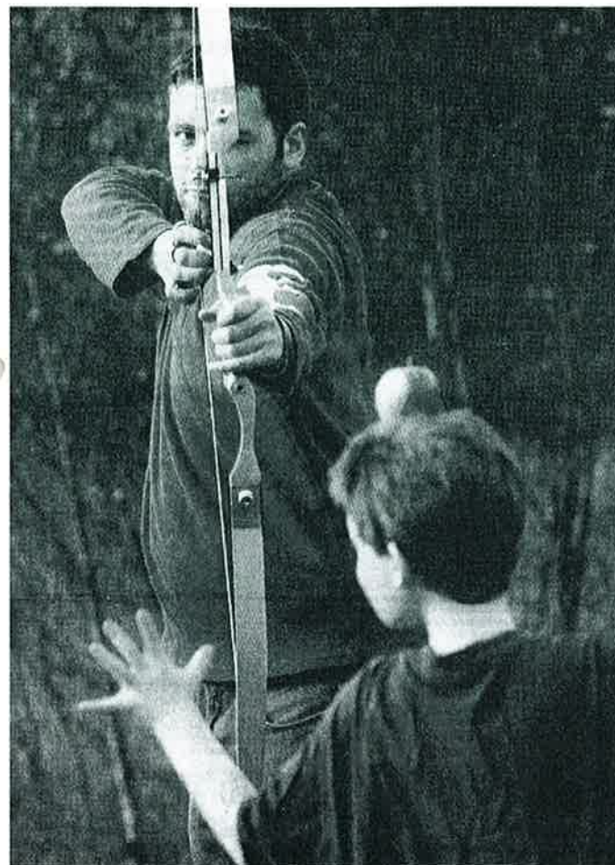
Drama: Sannhetens øyeblikk. Med dæsforket er det klart for rekonstruksjon av Wilhelm Tells 700 år gamle mesterskudd.