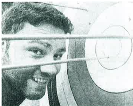
Lovende: Etter kort tid begynte pilene å finne innertieren.