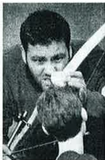
Bekymret: Med et par trøstens ord plasseres eplet på hodet til «sønnen».