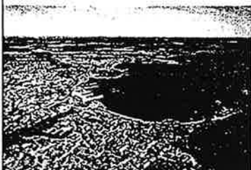
Om Larvik kommune

FØLGENDE DATOER: ons. 7/6, ons. 21/6 og fre. 7/7 (alle dager kl.18, påmelding ved fram møte, startavgift 50kr og 30kr.)