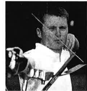
Flute - hit men ikke lenger..

Flute forsvant i denne runden etter relativt svak skyting mot nederlandereren Van Alten (som vi husker vant matchskytingen i Stavanger sist vinter).