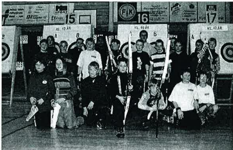
Fra KM i Sør-Trøndelag!