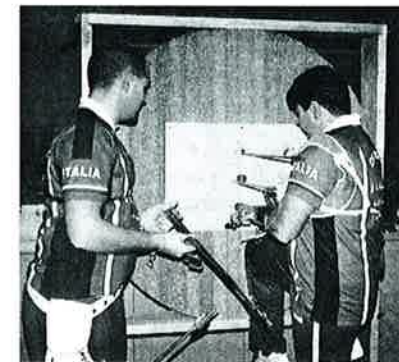
Frangilli og De Buo teller opp.

Vel, ikke uventet vant Ukraina over Tyskland blant damene, og Italia slo Tyrkia i herrenes oppgjør. Innledningsvis var treffprosenten nede i ca. 30, men skytterne ble dyktigere ut over dagen - og det ble mer treff enn bom etter hvert. Italias toppede herrelag ble som ventet for sterke for damene fra Ukraina, som for øvrig bet bra fra seg. Til glede for hjemmepublikum skjøt Tyrkia etter hvert meget bra og sikret seg tredjeplassen.