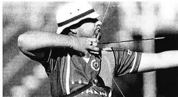
Verdens beste bueskytter? Michele Frangilli vinner det meste.

dørs), holdt både venstream og nerver i ro til å ta nok et VM-gull.