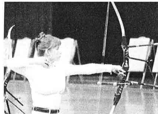
Valeeva - kanskje hun kunne bosette seg i Norge en tid også?

For øvrig imponerte selvsagt også nå så erfarne Natalia Valeeva stort. Hun har nå klart bragden å vinne tre innendørs-VM for tre forskjellige nasjoner: Sovjetunionen, Moldova og nå for Italia.