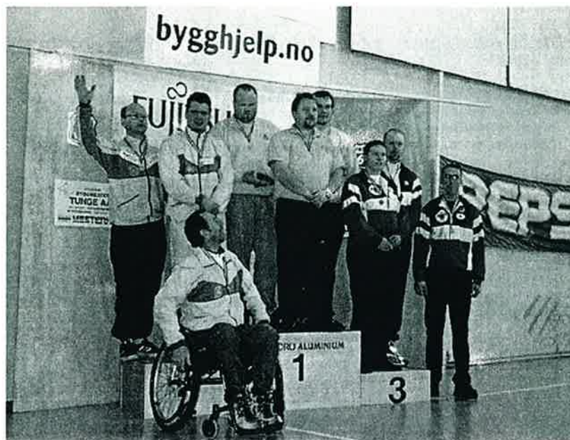
Glade medaljevinnere i compound-herrenes lagkonkurranse