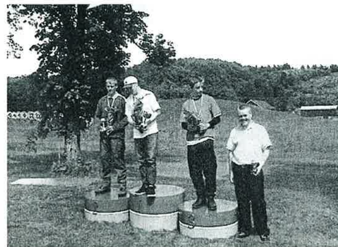
Så var det medaljeutdeling i idylliske omgivelser - her i klasse Compound Gutter y.jr.