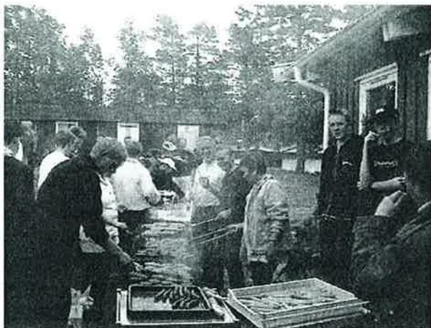
Og her gikk grillmaten unna...

Nok en gang hadde Sandefjord Bueskyttere sagt ja til å stå som arrangør for et Nordisk Mesterskap for juniorer. Denne gangen var det i Feltskyting. Noen bange anelser for å stå som arrangør for et nordisk i felt hadde vi etter det som skjedde i Danmark for to år siden, hvor alt ble avlyst på grunn av for liten deltagelse. Litt med dette i bakhodet ønsket klubben å legge forholdene til rette for et opphold skytterne skulle huske som noe positivt. Vanligvis har alltid innkvarteringen blitt lagt til en skole og de forhold som der finnes for overnatting etc. Vi fikk tidlig tak i et leiersted ( Solløkka ) utenfor Sandefjord hvor det var brukbart med overnatningsplasser (ca 70.) Ut fra tidligere års dårlige respons mente vi at dette ville være stort nok.