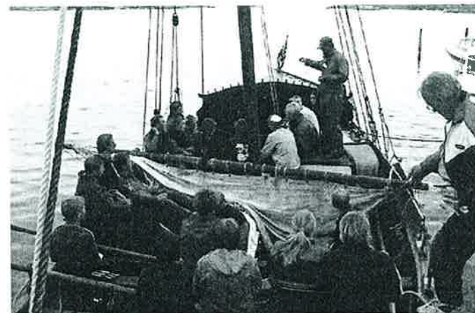
Og skuta den seilte...

Videre var det mulig å få en tur på vannet med en kopi av et Vikingskip med plass til ca 20 personer . Båten måtte gjøre tre turer før alle var forsynt . Deretter spilte et ungdomsband opp en stund, før alle ville til ro. Frokost ble servert fra tidlig søndag morgen av klubbens aktive damer.