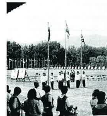
Et andekkelig øyeblikk da det norske flagget gikk til topps!

Dette viser at Norge presterte sin beste konkurranse som nasjon noensinne. Jeg håper virkelig at det kan satses mer penger på compound i årene som kommer. Disse skytterne fortjener virkelig dette. Jeg vil også takke alle for glimrende respekt og godt samhold. Uten dette hadde vi aldri oppnådd det vi gjorde.