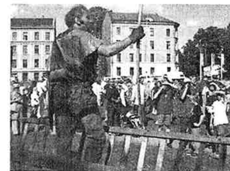
Lederen for Langbuelaget holdt foredrag fra Høyvogna ved Clementskirken.