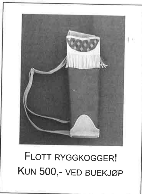
FLOTT RYGGKOGGER! KUN 500,- VED BUEKJØP

Norsk Buesport ønsker velkommen med tilbud på alt dere trenger av utstyr til buene.