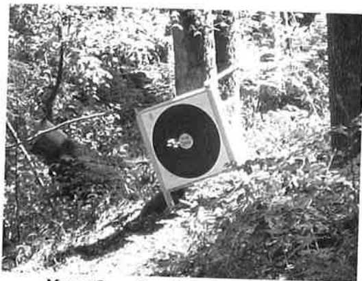
Mange fine mål under mesterskapet!