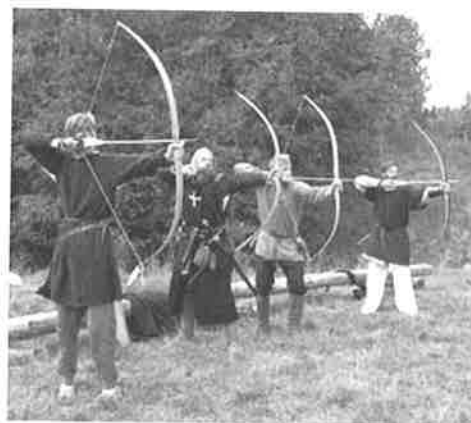
Et "klipp" fra skytelinje under årets NM!