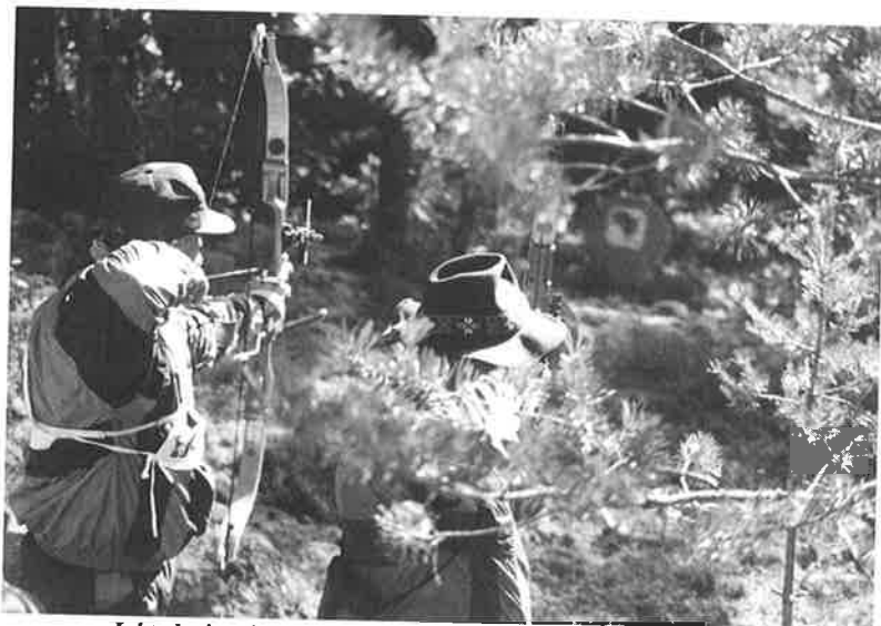
Jakt-skyting (arkivfoto) – både utfordrende og morsomt!

Vollan IK sto for det tekniske arrangementet av begge disse norgesmesterskapene etter en intern avtale i Sør-Trøndelag Bueskytterkrets som tro til i egenskap av "reservearrangør" for disse mesterskapene. Det er ikke mye tradisjon for jakt- og feltskyting i Trøndelag og de fleste var nok litt spent på både antall deltakere og gjennomføringen av arrangementet.