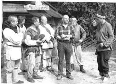
Vinnerne derimot hadde tydelig hatt et lengre høydeopphold i Imsdalen, noe som jo er helt lovlig.