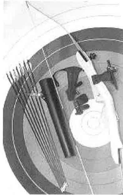
ENKELT BUESETT VIST UTEN BUEKOFFERT.