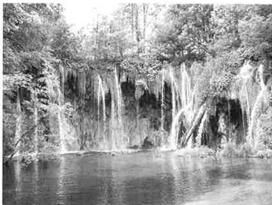
Idyllisk, men krevende !

Tirsdag var det kvalifisering med 24 mål ukjent avstand og svært varmt. Området for start og oppvarming var lagt til øverste del av parken. Dit var det kun adkomst via spesialtog; dvs trekkvogn med to vogner hvor bakhjulene også svingte for å klare hãmålsvingene.