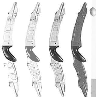
WIN&WIN EVOLUTION MIDTSTYKKE

Vi har fremdeles et godt utvalg av lemmer tilgjengelig.