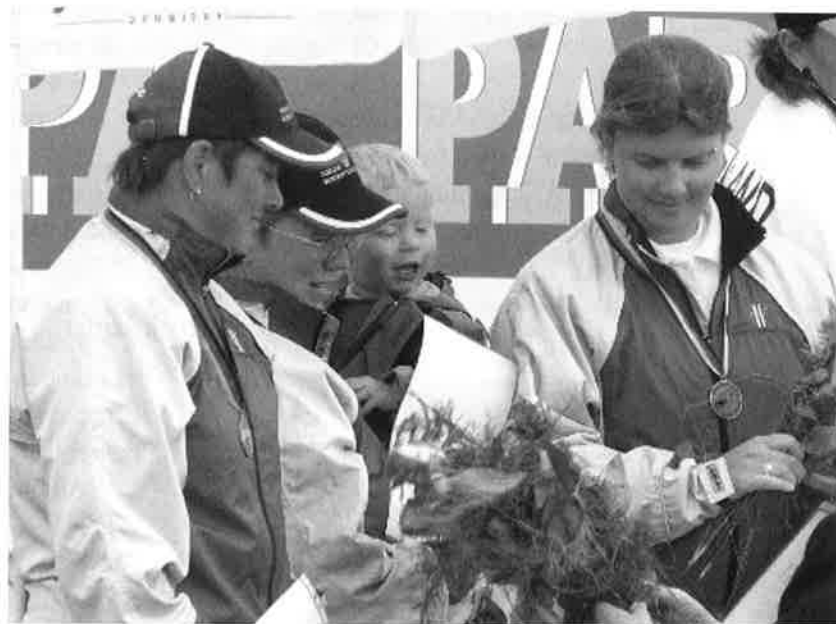
Det ble andreplass også på compounddamene. Her på pallen sammen med "maskot'en"

Damene skulle møte tyskerne i sin semifinale. Dette ble også en opplevelse vi sent vil glemme. Etter de 9 første pilene var resultatet 83-83. Da 18 piler var skutt var resultatet 166-165 i Norges favør. Etter 27 skutte piler var resultatet 249-249, altså nok en shoot-off for våre skyttere. En pil fra hver av skytterne på lagene skulle skytes innenfor ett minutt. Resultat Norge-26p-Tyskland-24p og dermed hadde vi nok en finalist i lagskytingen. Nederland ble også vår motstander her. Disse ble for sterke denne gang og gikk seirende ut med sifrene 247-240. Nok en sølvmedalje til Norge. Meget bra jenter!