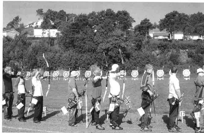
Sånn så det ut fra skytelinjen og midt i bildet har man samlet tre nasjoner på et brett!

Oppgaven ble nok noe større enn først antatt fordi manglende rutine i konkurransearrangement i tillegg til at noen flere biter skal på plass når ca. 120 ungdommer skal innkvarteres og bespises, gir ekstra utfordringer.