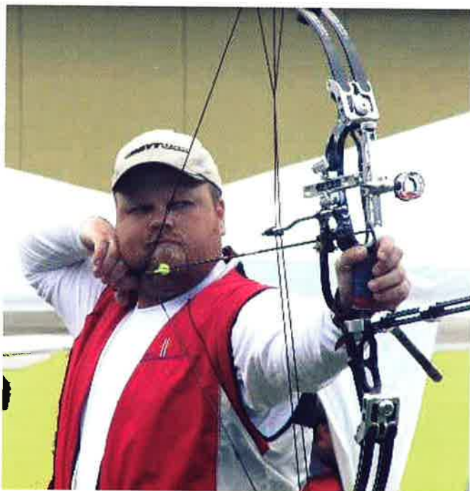
MORTEN BØE - VM-BRONSE OG NY VERDENSREKORD