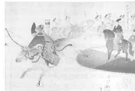
Et tresnitt fra 1890 (av Chikanobu) som man ser her, viser en Inuoumono-konkurranse. Bueskytterkonkurranser fra hesteryggen har foregått i 1300 år...

Med delvis spirituelle, mentale og fysiske øvelser med sterk seremoniell aspekt, mente de japanske bueskytterne, kyudokas, at denne ulike formen for konkurranser skapte et middel for å skjerpe hjernen.