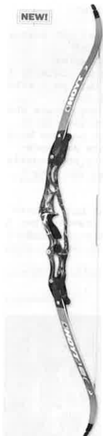
Ny modell for 2006