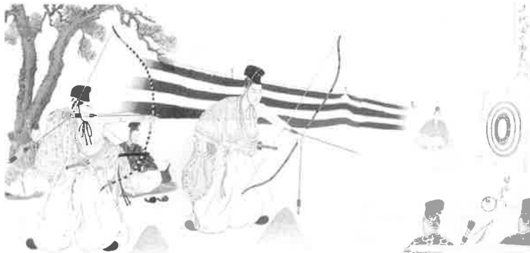
Et trykk (av Chikanobu) fra det 19. århundret illustrerer en tradisjonell japansk konkurranse. Chikanobus kunst var kjent for å beskrive tradisjonelle japanske verdier, som inkluderer stor respekt for bueskyting.