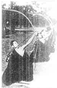
Japanske bueskyttere, i tradisjonell klesdrakt og med bruk av en klassisk bue, deltar her i det Japanske Kyudo Flight-mesterskapet i 1940.

Den Yayoiiske kulturen som dominerte det japanske øyriket fra 250 f.Kr. til 330 e.Kr. avbildet dets første mytologiske hersker, Jimmo, med en langbue som en symbol på hans autoritet.