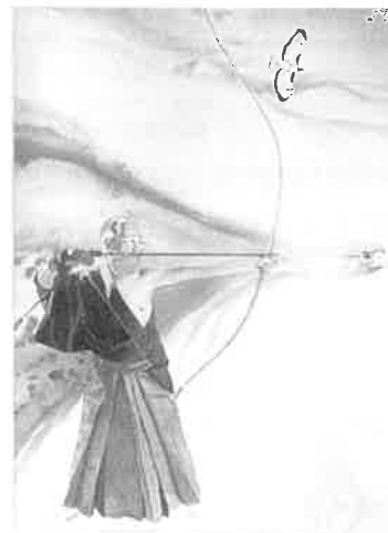
Øyeblikket før man løsner skuddet (Kai) er tidspunktet for ånden til å overta...

Det er også nedskrevet at en mann ved navn Yoitchi skjøt 8.133 piler i løpet av 24 timer. For å bli godkjent som en god bueskytter, måtte en trene på tre forskjellige nivåer – 300, 500 og 1500 piler daglig.