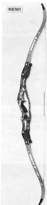
Ny modell for 2006