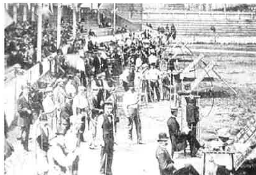
Amerikanske bueskyttere deltar her ved National Archery Association sitt mesterskap som ble avholdt i Chicago i 1879. De forbereder seg til deltakelse i et arrangement som er blitt holdt sammenhengende i 125 år.

Kanskje en av den viktigste bueskyttergavene fra USA er gjennom filmer fra Hollywood. Mange helter og heltinner, både mytologiske og historiske, fra land over hele verden, er blitt udødeliggjort på sølvlerretet. Legenden om Robin Hood er ikke bare den mest berømte historien om en bueskytter, men inneholder den fantastiske av alle konkurranseskudd – da Robin Hood skyter sin pil midt i blinken, og splintrer motstanderens pil for å vinne konkurransen.