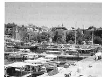
Antalyas koselige havneområde.....