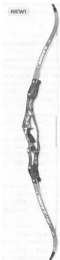
Ny modell for 2006