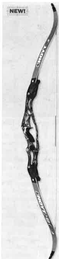
Ny modell for 2006