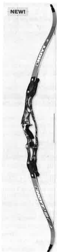
Ny modell for 2006