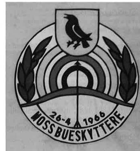
Her ser vi Mosse-kråka i "egen høye person".

Så var det tid for sikteteknikker. Det finnes ingen norsk nestor innen historisk bueskyting lenger, de forsvant ved siste verdenskrig. En del amerikansk skytelitteratur finnes heldigvis, arven etter Howard Hill, Art Young og nålevende Byron Ferguson er verdifull. Men alle disse er jaktskyttere. Vi kom frem til at man må skille mellom jakt og skiveskyting med hensyn til teknikk. Det såkalte og noe diffuse begrepet "instinktskyting" egner seg best i jakt på ukjente avstander. Begge øyne oppe, fokus på blink, noe kantet bue, aktiv fremoverbøyd. Split vision og gapshooting er også begreper innen denne skytemåten. Jo større "gap" mellom pil og mål, desto nærmere målet er du. På skive og ved kjente avstander kan man med fordel sikte med pilspiss, og med mer rett opp kroppsstilling etc. En blanding av disse teknikker, mange svært individuelle, kan føre til svært gode resultater. Vi fikk se et eksempel på feilen "saging" med utmerket resultat på blinken. "Saging" er når du ikke klarer helt å bestemme deg for å slippe pilen. Ørlite frem og tilbake. Vel, konklusjonen var, og som jeg tror alle var enige om: "Du kan gjerne skyte som en kråke (Mossekråke) bare du skyter likt hver gang. Moss BS og deres egen "Elling" var også en verdifull bidragsyter.