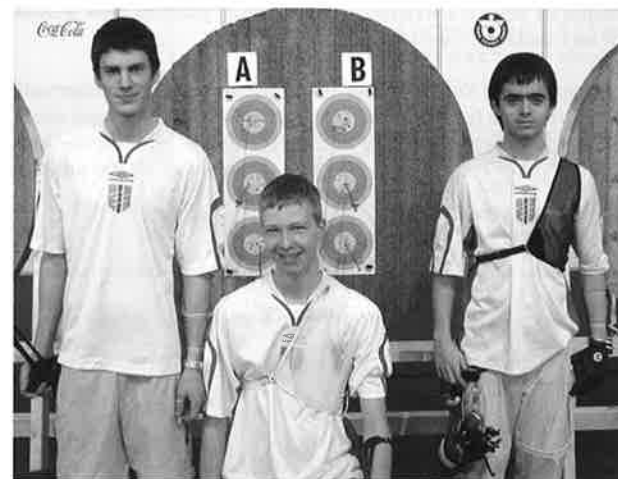
Verdensrekord og 4. plass er gode minner å ta med seg fra Tyrkia

Så skulle vi møte nettopp Tyrkia – det ble litt av en opplevelse. Det var sikkert en heigieng på bort imot 100 tyrkere bak skytelinjen og spenning så svetten silte og neglebitingen ikke stoppet før albuen. Lagene fulgte hverandre nærmest pil for pil, med tyrkerne gjerne et fattig poeng foran. Og under scoringen i siste omgang så vi at en dommer var tilkalt for å dømme en norsk pil. Han så fra den ene siden og deretter fra den andre siden (slik han selvsagt skal), men for oss virket det som om han holdt på en evighet. Så ble det høyeste score – og vi hadde vunnet matchen med 225-224, til store protester fra tyrkerne (på dommeravgjørelsen).