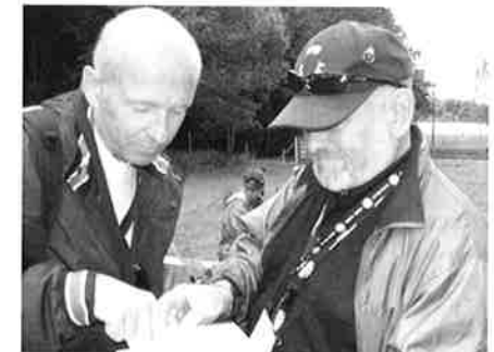
Generalsekretær og president tipper resultatet på Deltaker-toppen i år...